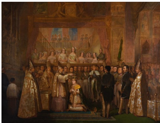
Kronado de Petro la 2-a, en la 18-a de julio 1841, kiam li estis 15-jara - laŭ pentraĵo de François-René Moreaux.

Petro la II-a opiniis grave apogi enmigradon kiel ilon por bona uzo de la tero. Samtempe li volis fortajn armeojn por garantio de la suvereneco,