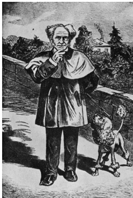
Schopenhauer kun sia pudelo Atmo (Animo)

— Kompreneble. Sciu ankaŭ, ke en mia jarcento oni ne memoras vin nur