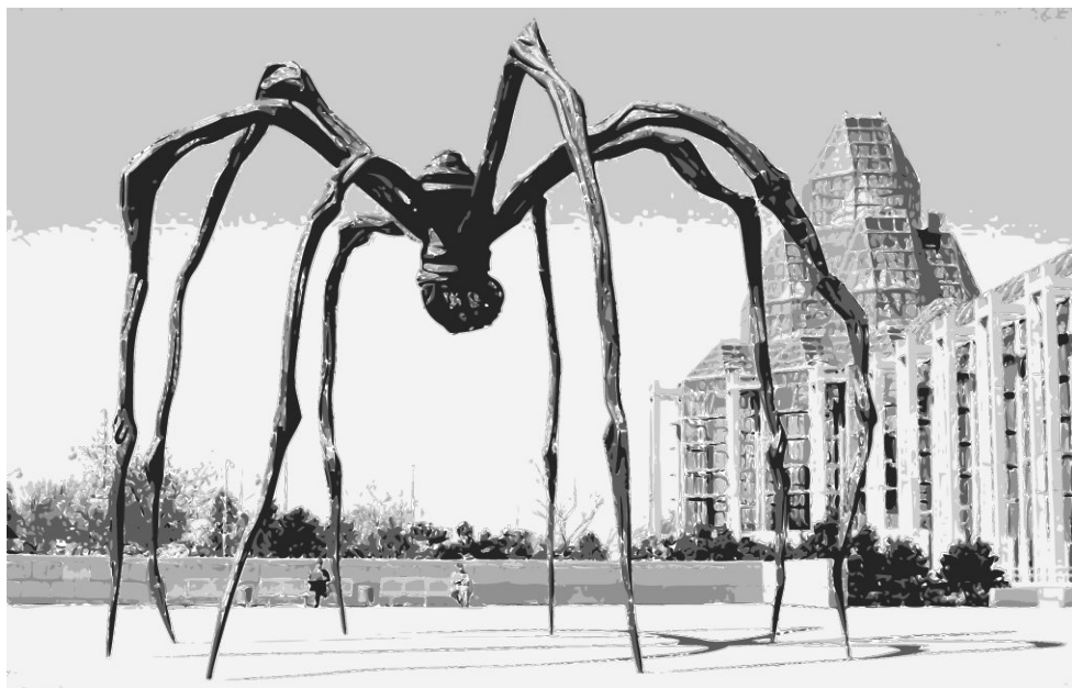
Skulptaĵo 'Maman' (1999) de Louise Bourgeois situanta ekstere de la Nacia Artgalerio de Kanado.