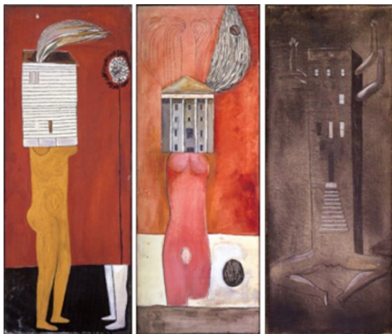
Tri eroj el la pentraĵo-serio 'Femme Maison'

Ĉu vi ĝuis iom pli koni pri tiu fantasta artistino Louise? Esploru pli pri ŝi kaj ĝis la sekva fojo!